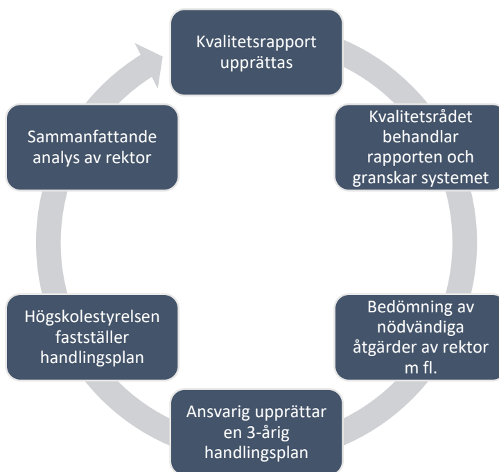
Figur 3 Modell för Johannelunds kvalitetssystem

För varje inriktning/område ovan finns även bedömningsgrunder formulerade, vilka används såväl som stöd i skrivandet av rapporten som när utbildningen sedan bedöms. För varje inriktning/område finns ett antal frågor formulerade som syftar till att klargöra vilken information som behövs för att beskriva och bedöma inriktning/området. I kvalitetsrapporten ska även i för rapportens typ relevanta nyckeltal redovisas och analyseras, såsom 1) antal studerande, 2) antal kvinnor och män, 3) antal förstahandssökande, 4) genomströmning och 5) tid till examen. Samtliga nyckeltal redovisas och analyseras uppdelade på campus och distans. I arbetet med att färdigställa kvalitetsrapporten ingår även att den ansvariga för utbildningen förankrar innehållet i rapporten i kollegiet, med studentkåren samt med representanter för avnämare.