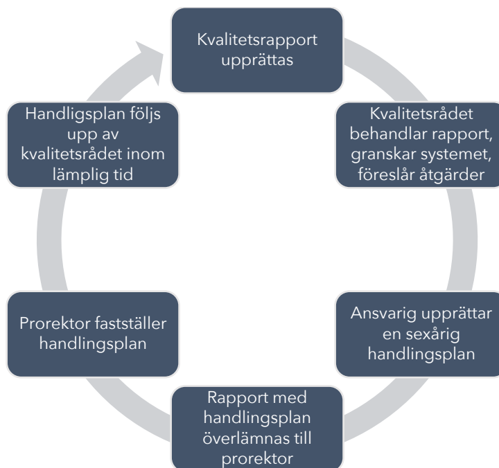
Figur 2: Modell för Johannelunds kvalitetssystem

Kvalitetssäkringen av ett utvärderingsobjekt startar med att ansvariga för utbildningen skriver en kvalitetsrapport, utifrån mallar framtagna av kvalitetsrådet.